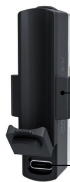
Mocowanie na silikonowy pasek Port ładowania USB-C